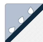
PROTECTION CONTRE L'ÉROSION

Le géotextile MIRAFI MD FW500 est composé de fils de polypropylène monofilament et fibrillés à haute ténacité, qui sont tissés en un réseau stable de sorte que les fils conservent leur position relative. Le géotextile MIRAFI FW500 est inerte à la dégradation biologique et résiste aux produits chimiques, aux alcalis et aux acides présents dans la nature.