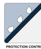
PROTECTION CONTRE L'ÉROSION

Le géotextile MIRAFI MD FW300 est composé de fils de polypropylène monofilament et fibrillés à haute ténacité, qui sont tissés en un réseau stable de sorte que les fils conservent leur position relative. Le géotextile MIRAFI FW300 est inerte à la dégradation biologique et résiste aux produits chimiques, aux alcalis et aux acides présents dans la nature.