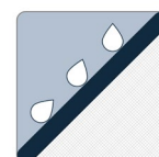
PROTECTION CONTRE L'ÉROSION

Le géotextile MIRAFI MD FW300 est composé de fils de polypropylène monofilament et fibrillés à haute ténacité, qui sont tissés en un réseau stable de sorte que les fils conservent leur position relative. Le géotextile MIRAFI FW300 est inerte à la dégradation biologique et résiste aux produits chimiques, aux alcalis et aux acides présents dans la nature.